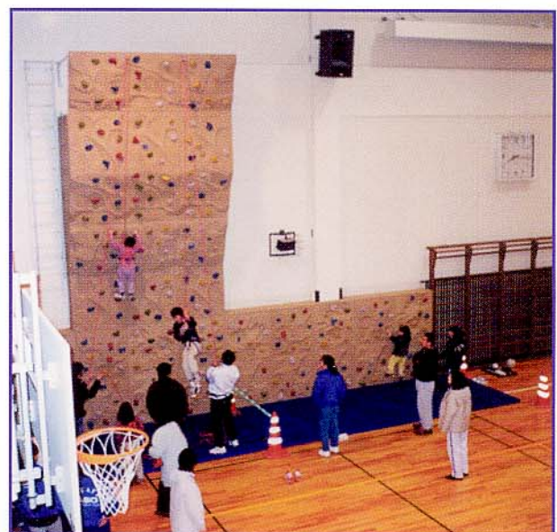
DATE: 熊本/国立阿蘇青年の家 青少年の健全育成の一環として。