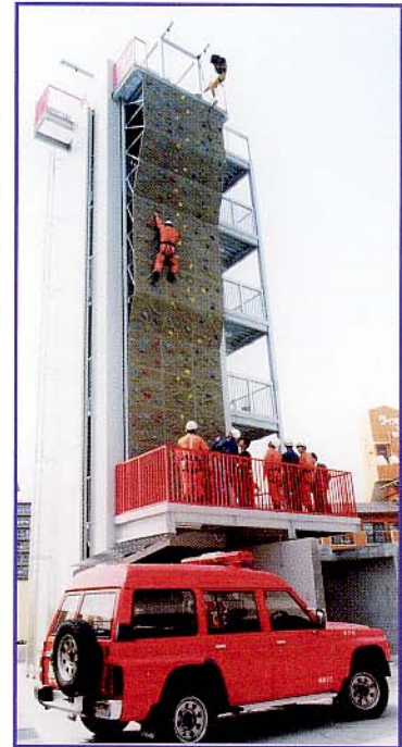
DATE: 兵庫県神戸市北消防署 レスキューの訓練として用いられています。