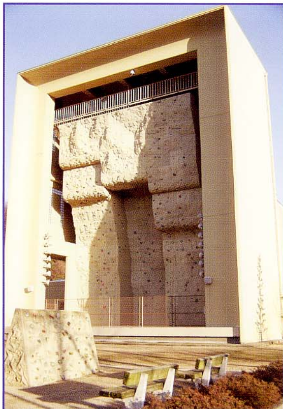
DATE: 福井県立クライミングセンター 高さ15メートル、世界最大級のGFRCクライミングウォールです。