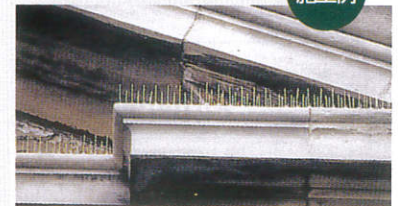
▲φ1.3mmのピンなので地上からの美観を損ないません。