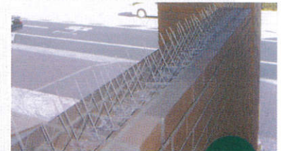
▲鳥の隙間への侵入を防ぎます。